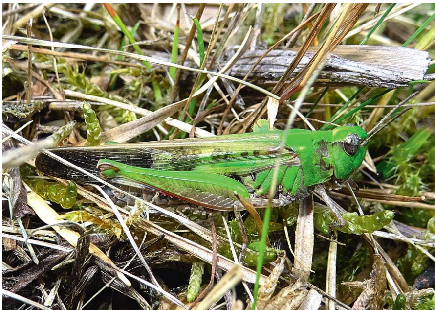
Abbildung 1: Weibchen der Grünen Strandschrecke. Westlich Busenberg, 15. August 2019.

Die Grüne Strandschrecke wurde im Pfälzerwald nahe Busenberg auf einer mäßig trockenen Wiese (Weide) an einem nordexponierten Hang entlang der B 427 gefunden (Abb. 3). Vegetationskundlich entspricht der Biotop einer typischen Glatthaferwiese, wobei das stellenweise Auftreten von Succisa pratensis , einem Wechselfeuchtezeiger, auf eine partiell höhere Bodenfeuchte schließen lässt. DETZEL (1998) weist darauf