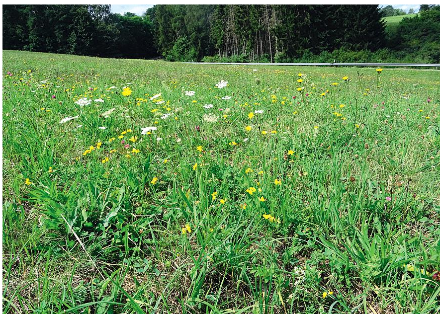
Abbildung 3: Fundort der Grünen Strandschrecke im südlichen Pfälzerwald, westlich von Busenberg, 15. August 2019.

Auf den angrenzenden Wiesen im feuchten Talbereich wurden Sumpfschrecken, jedoch keine weiteren Grünen Strandschrecken gefunden. Demzufolge kann davon ausgegangen werden, dass die Population nur klein ist. Wo ihr Populationschwerpunkt liegt, ist noch unklar. In diesem Zusammenhang schreibt DETZEL (1998), dass die Pionierart weite Strecken zurücklegen kann und deshalb oft nur Einzeltiere angetroffen werden. Von 43 Nachweisen, die im benachbarten Baden-Württemberg von 1980 bis 1998 zusammengetragen wurden, waren 15 Funde von Einzeltieren. Es wird interessant sein zu beobachten, ob und in welcher Geschwindigkeit die Grüne